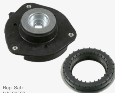
Rep. Satz febi 22502

Weitere technische Informationen finden Sie unter: partsfinder.bilsteingroup.com