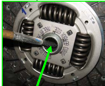
Nehmen Sie nur wenig Fett.